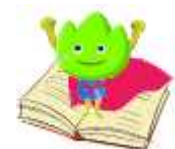
スクールキャラクター(ヤーマン)